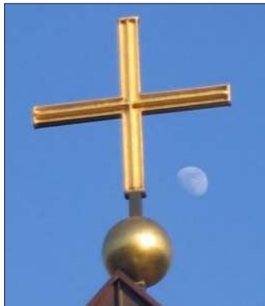
Im Jahre 2002 wurde das vergoldete Kreuz auf der Weltkugel übergeben.