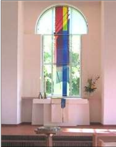
Dieses Altarfenster wurde am 1. Adventssonntag 2005 eingeweiht.