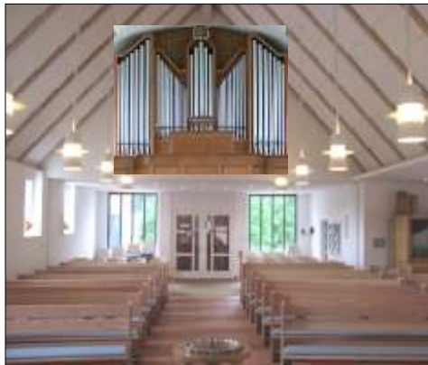
Seit 2010 sammeln wir Spenden für eine neue Orgel, so könnte sie vielleicht einmal aussehen: Die Empore für die neue Orgel ist im Bau, die Einweihung erfolgt am 29. September 2013 im Gottesdienst

Förderverein e.V. der Bartholomäus-Kirchengemeinde Boostedt